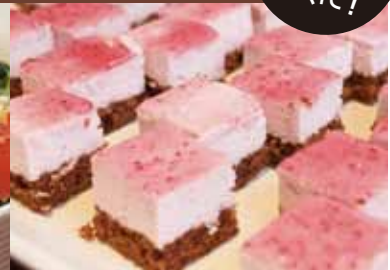
ベリーベリーのムース