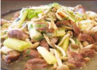
県産長ネギと砂肝のコフヒ