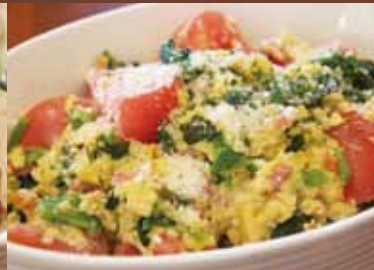
ほうれん草とベーコンエッグのサルタレ